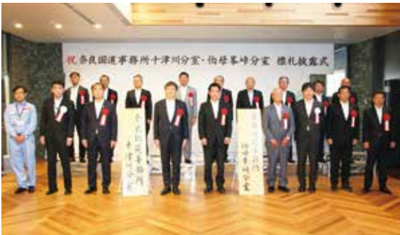
▲6月4日、標札披露式 = 五條市役所