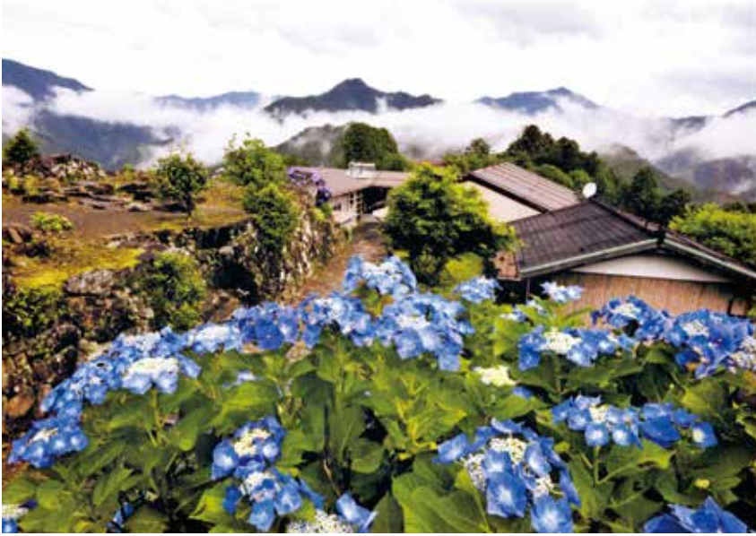
小辺路のアジサイ(大字桑畑)