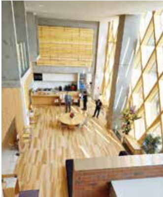
▲同日、新十津川町の新しい役場庁舎の 完成記念式が行われ、庁舎内を見学した。